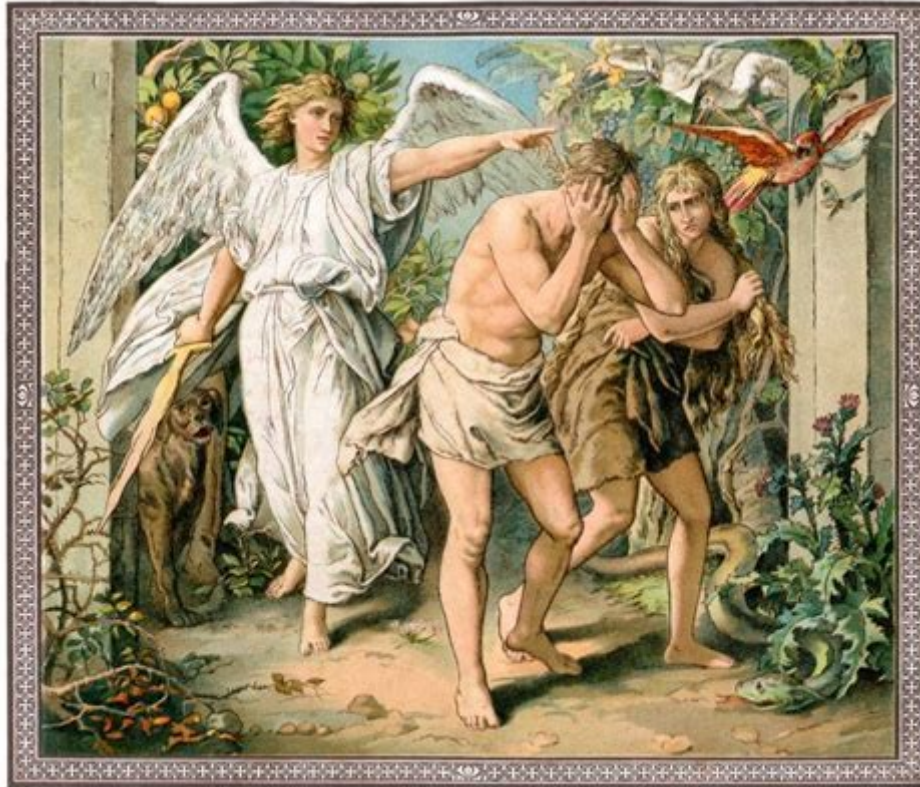
Adam and Eve cast out of Paradise.