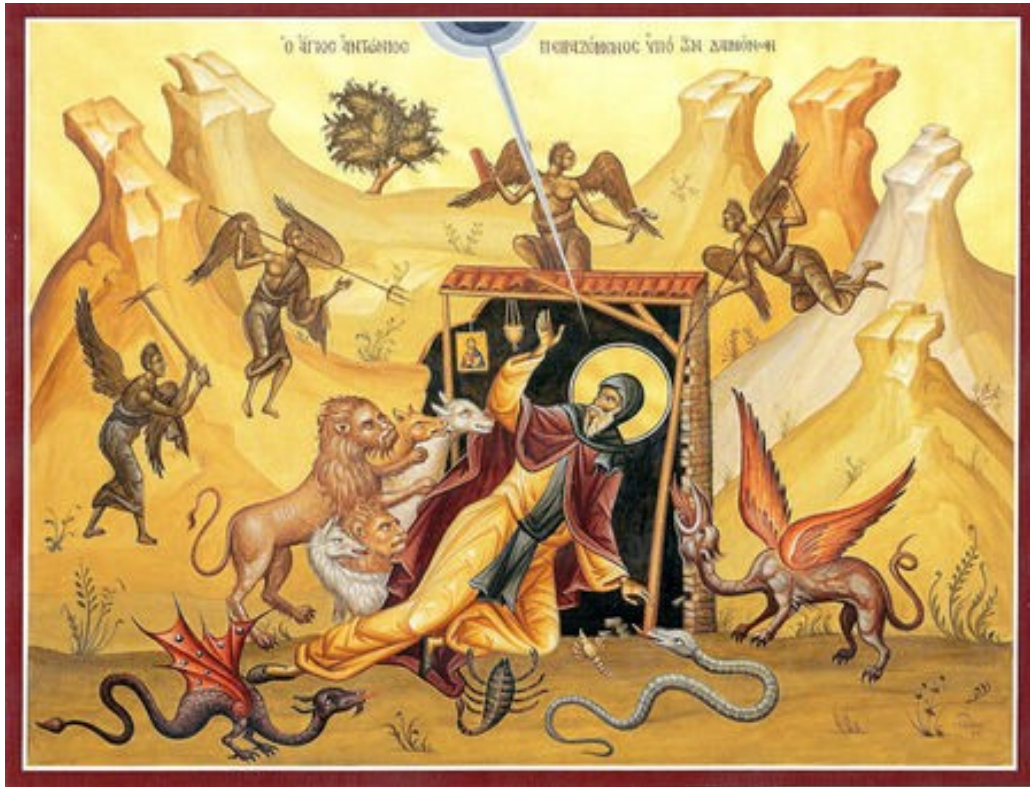
Oben: Die Höllendämonen bekriegen den Heiligen Antonius