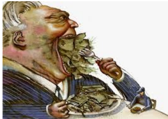
Oben: Guten Appetit!