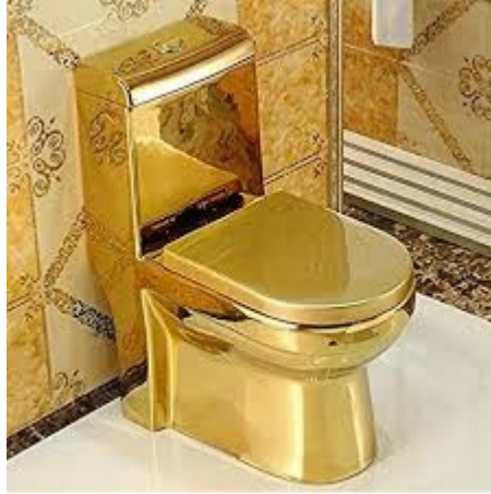
Oben: Der wahre Weg der stolzen Luxuswelt