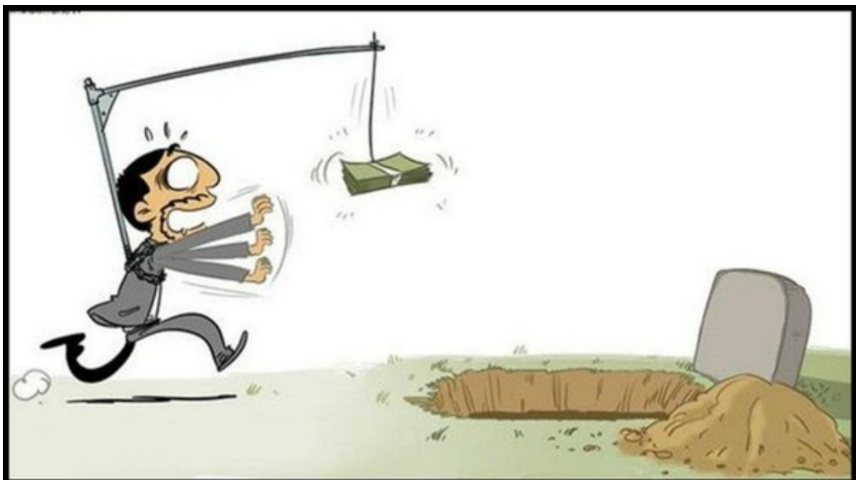
Gott aber sprach zu ihm: „Du Tor! In dieser Nacht wird man deine Seele von dir fordern. Was du aber bereitet hast, für wen wird es sein?“ Lk 12, 20