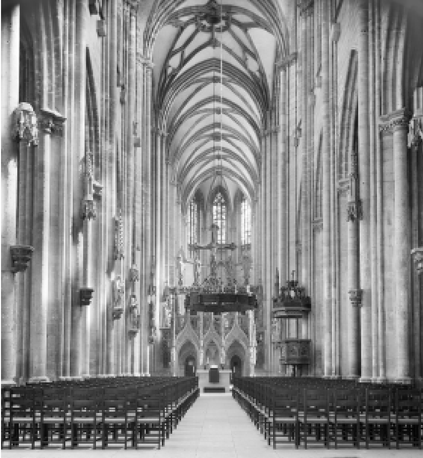
4. Halberstadt, Dom: Langhaus mit Blick auf die Triumphkreuzgruppe (1220/30)

fährlich und verdammungswürdig? Fraglos scheint darüber hinaus, daß es sich bei den im Alten Testament geschmähten Götzen einschließlich des goldenen Kalbes ausnahmslos um statuarische Darstellungen handelte 24 . Die Zerstörung der plastischen Idole des Heidentums geriet zu einem beständigen Motiv der mittelalterlichen Hagiographie, das sich sowohl literarisch als auch ikonographisch umfassend niederschlug 25 . Dennoch bleibt zu fragen, ob es sich hier um mehr als einen anschaulich umzusetzenden Topos handelte. Frühchristliche