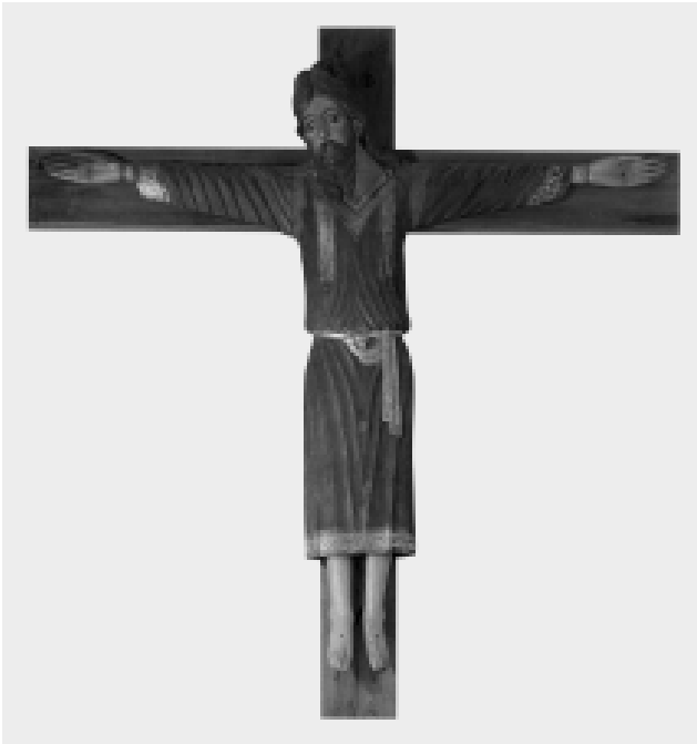
1. Sansepolcro, Dom, Volto Santo (7.-9. Jahrhundert)

Ihren Ausgang nahm die eher populär orientierte literarische Gattung von einem Brief des konstantinopolitanischen Patriarchen Michael Kerullarios, der seinem Amtsbruder Petrus von Antiocheia 1054 als unmittelbare Folge des Besuchs der päpstlichen Delegation in der Kaiserstadt einen Katalog mit 23 Abirrungen der Papstkirche zustellte 5 . Kardinal Humbert von Silva Candida, in seinem Auftreten nicht weniger selbstbewußt als Kerullarios, hatte die damalige Gesandtschaft geleitet und an dem unversöhnlichen Aufeinandertreffen der beiden Parteien entscheidenden Anteil gehabt, so daß die Ereignisse von 1054 heute als Meilenstein in der Geschichte des Ost-West-Schismas gelten. Die politischen Ereignisse der beiden folgenden Jahrhunderte, neben den Kreuzzügen die Plünderung Thessalonikis durch die Normannen (1185), die verheerende Eroberung Konstantinopels im Jahre 1204, aber auch die Unionsbereitschaft einzelner Kaiser wie Alexios' I. Komnenos und Michaels VIII. Palaiologos, die den Besuch einer weiteren päpstlichen Gesandtschaft in der östlichen Hauptstadt