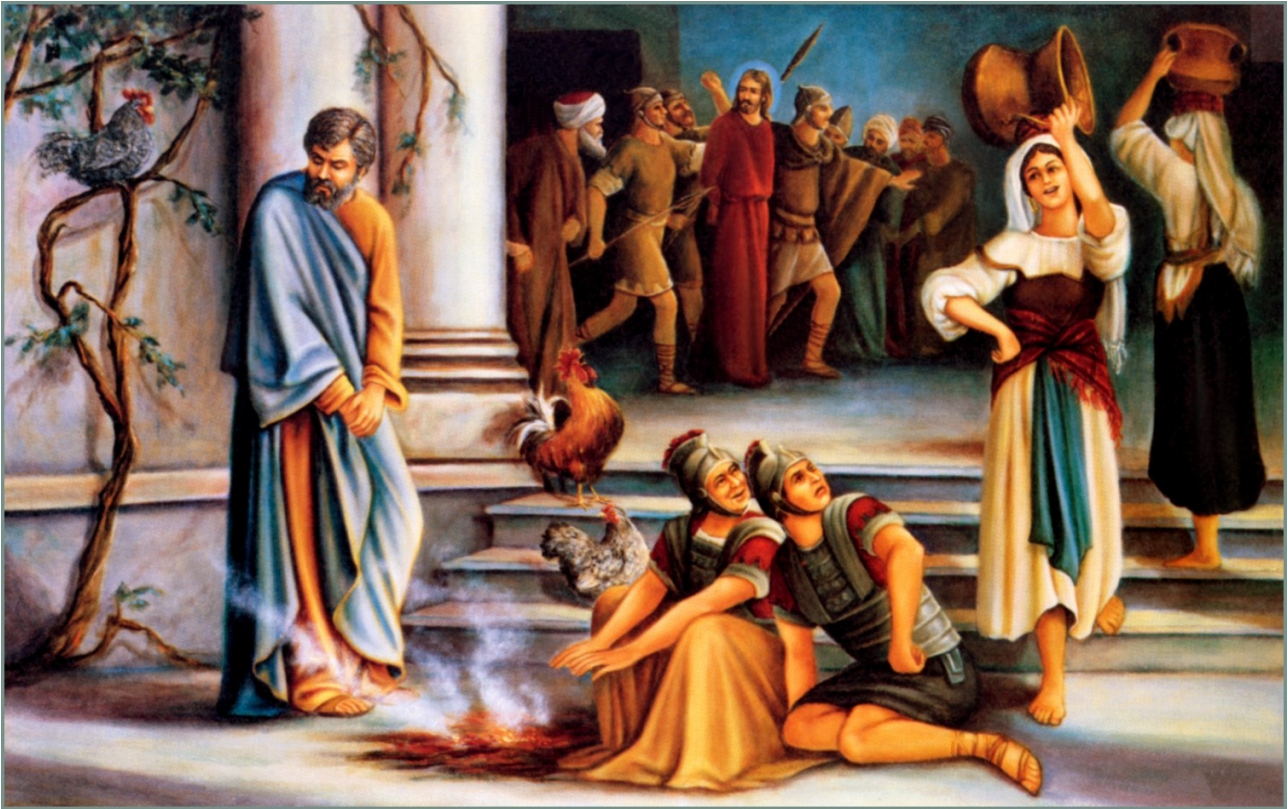
Oben: Der selbstsichere Petrus verleugnet Christus aus Menschenfurcht

„Dein Leben willst du für mich lassen? Wahrlich, wahrlich, ich sage dir: