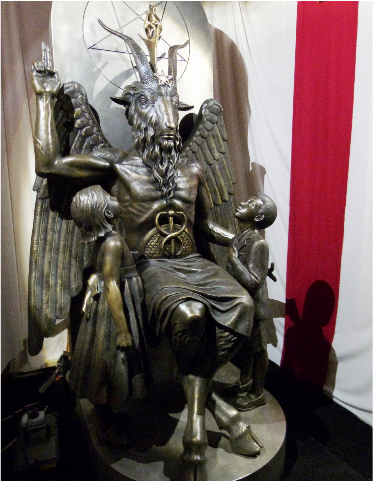
Der Dämon Baphomet (Satanic Temple, USA)

Satanismus: IN AMERIKA OFFIZIELL ANERKANNTRE RELIGION!!!!